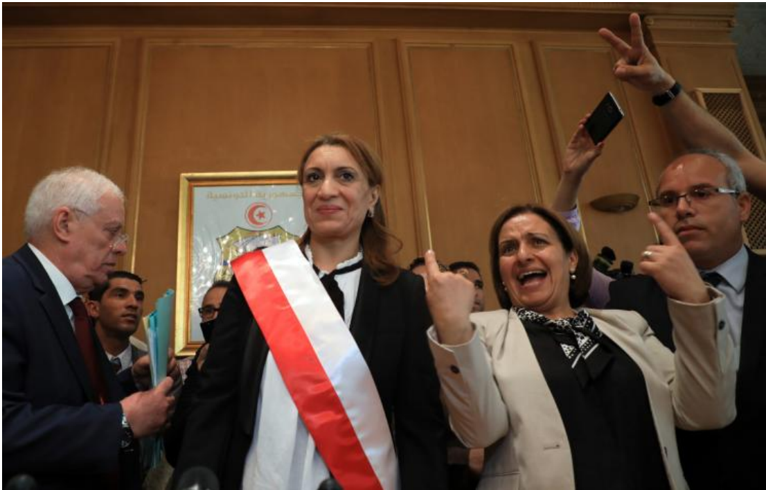
سعاد عبد الرحيم من حزب النهضة كأول امرأة تتولى منصب "شيخة المدينة" بتونس العاصمة - يوليو/تموز 2018