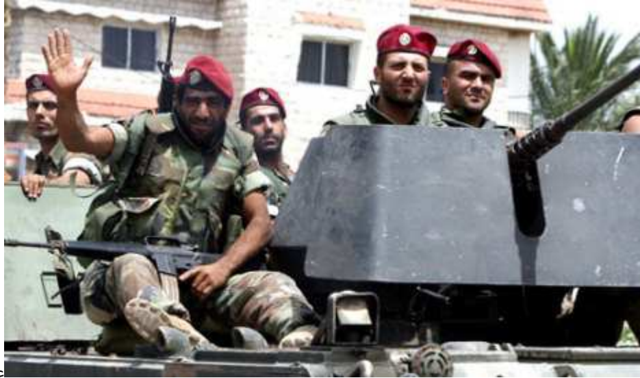
عناصر من الجيش